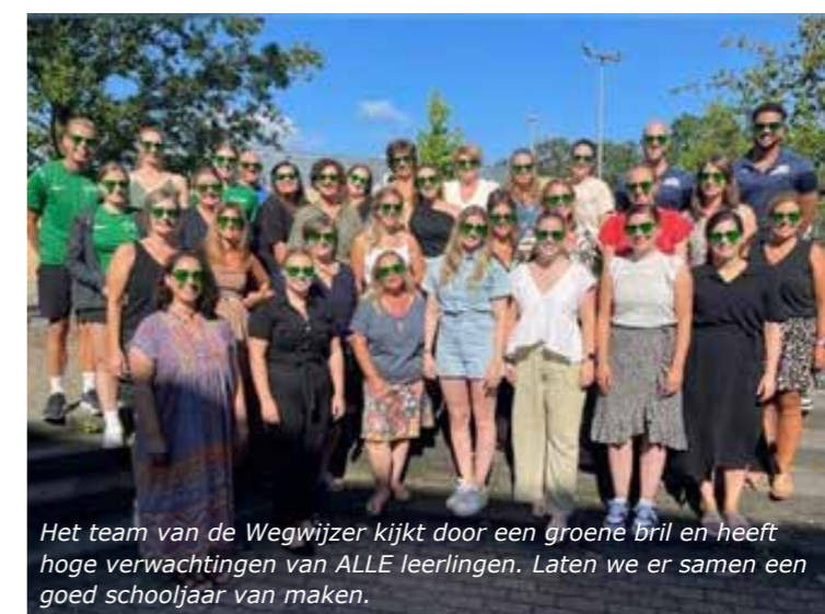
Het team van de Wegwijzer kijkt door een groene bril en heeft hoge verwachtingen van ALLE leerlingen. Laten we er samen een goed schooljaar van maken.

men er begeleiders die in de pauze met de kinderen sporten en zorgen voor uitdagende spelsituaties/ beweegmomenten.